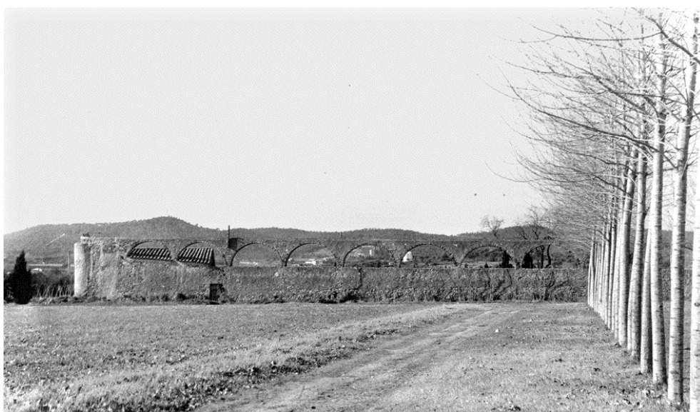
L'aqüeducte sencer, abans de l'obertura de l'avinguda d'Espanya.