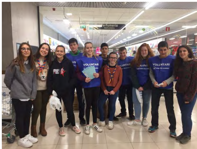
Gran Recapte d'Aliments