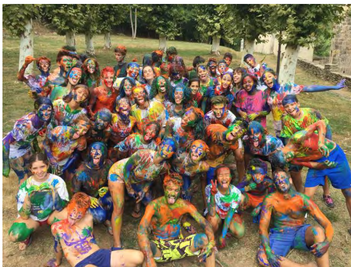
Colònies a Puigpardines