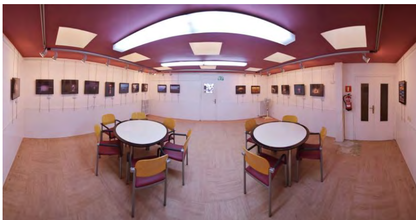
Sala d'exposicions de Can Genís