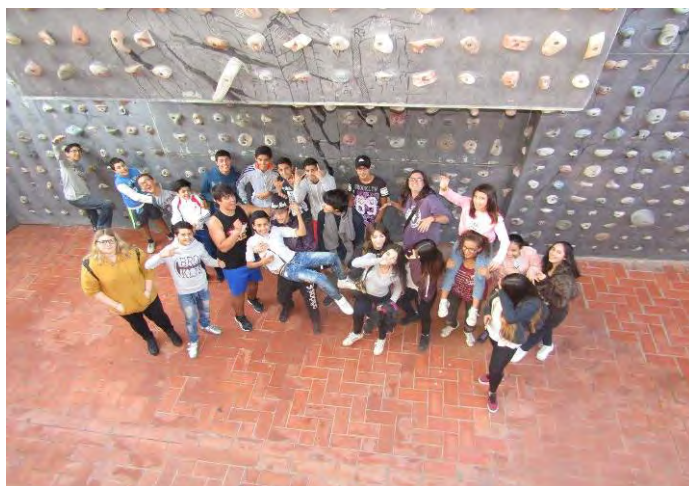
Joves participants a l'Espai Jove