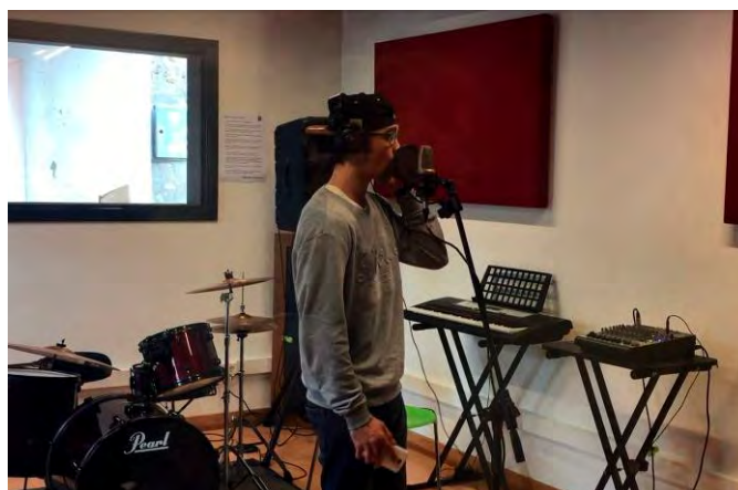
Jornada a l'estudi de gravació