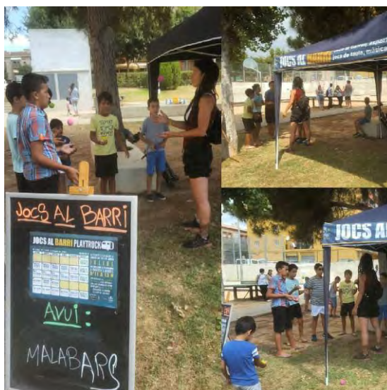
Jocs al barri a l'estiu