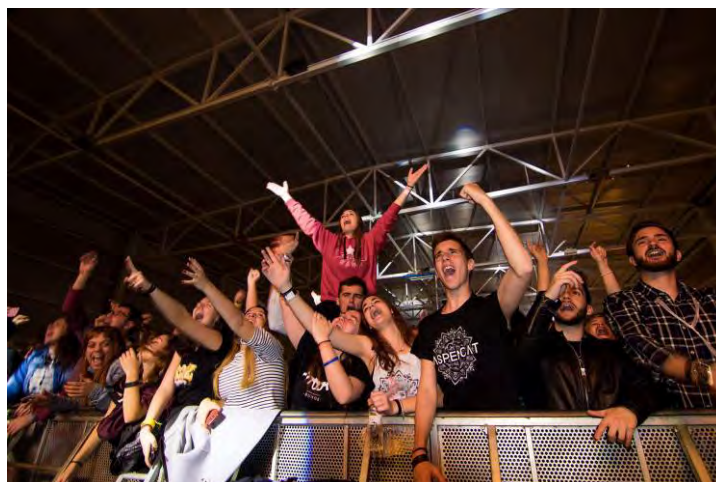
Concert Festa d'Hivern