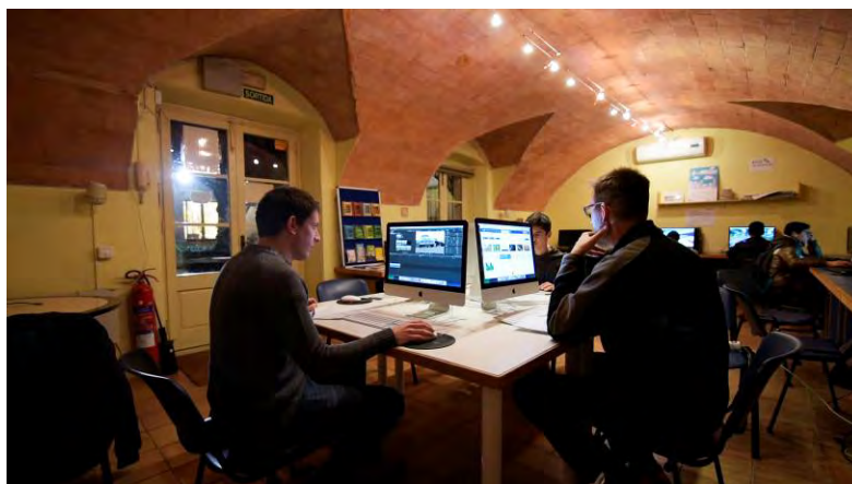
Curs d'edició de vídeo