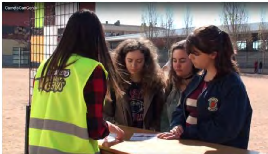
El carretó de Can Genís al pati de l'INS Frederic Martí Carreras