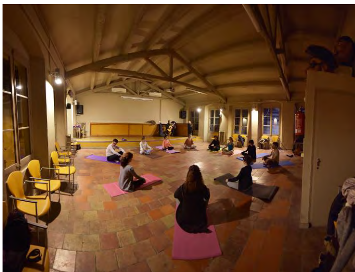
Taller de ioga